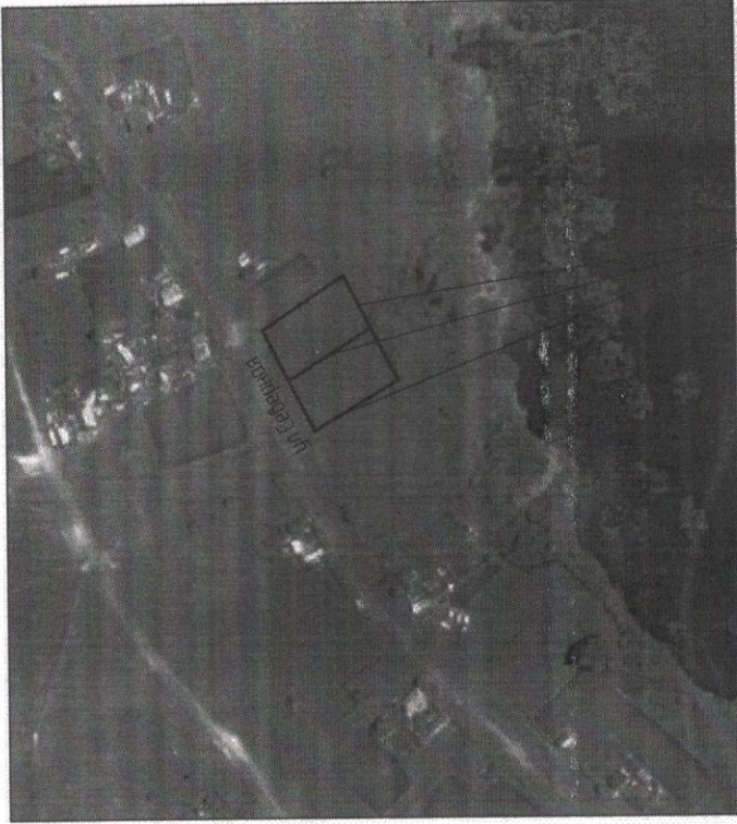
СХЕМА РАСПОЛОЖЕНИЯ ПРОЕКТИРУЕМОЙ ТЕРРИТОРИИ НА КАДАСТРОВОЙ КАРТЕ СИТУАЦИОННЫЙ ПЛАН